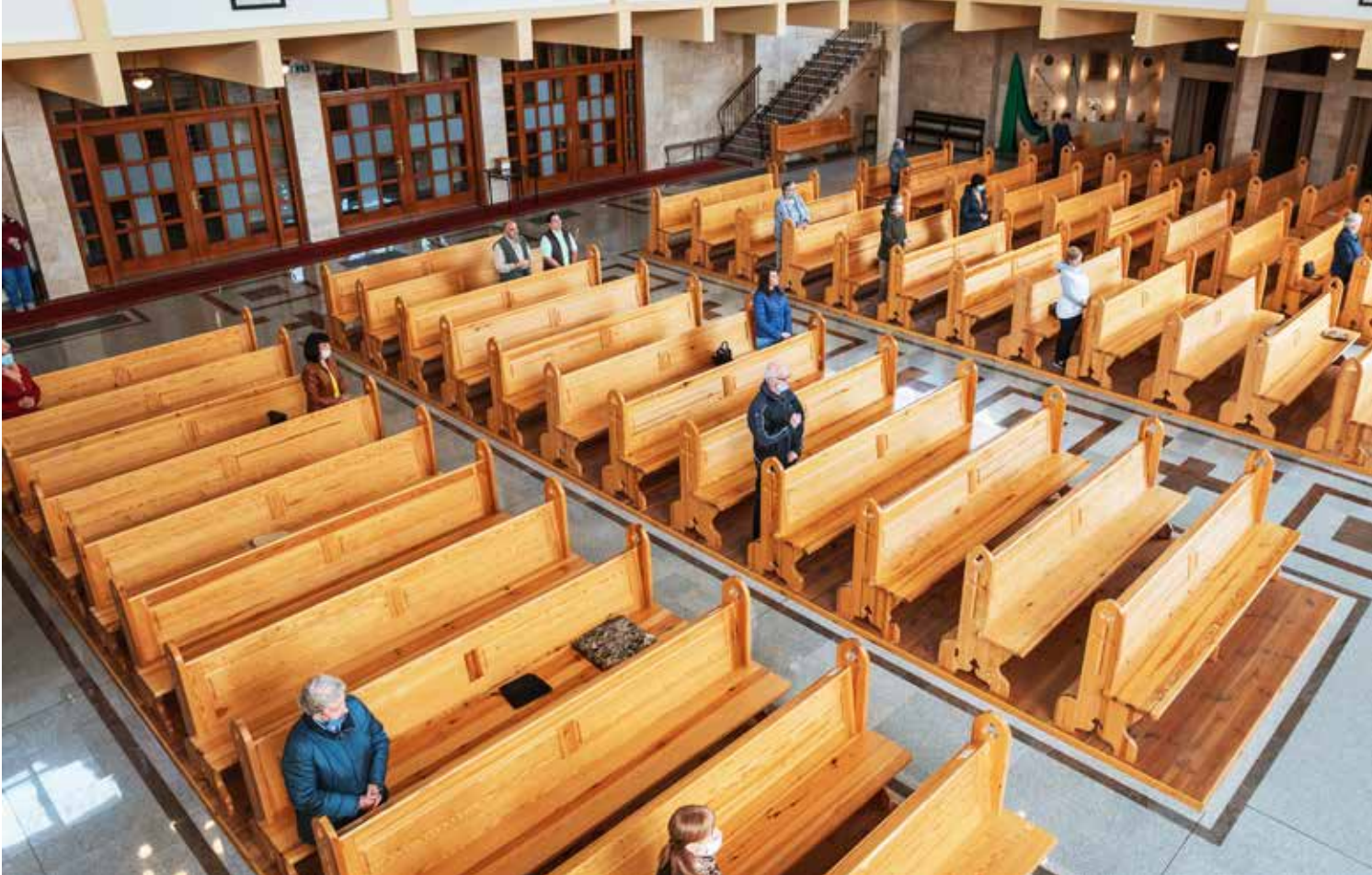
De coronacrisis doorbreekt alle vanzelfsprekendheden. Met de campagne #daaromzijnwekerk willen GZB, HGJB en IZB stimuleren dat in gemeenten het gesprek over de essentie van kerk-zijn wordt gevoerd.